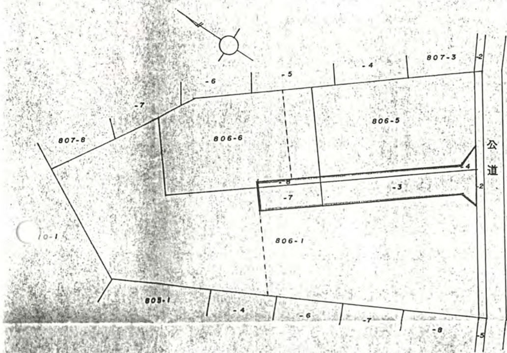
公図の写し S = 1 : 500