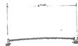
道路断面図 単位距離( M )