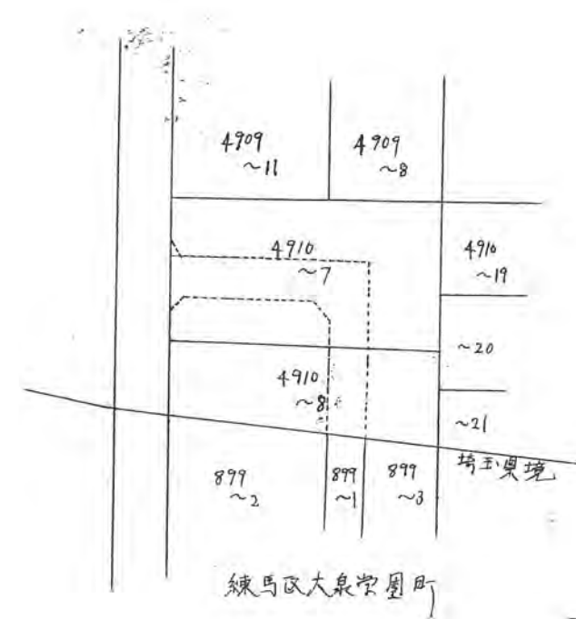
縮尺六百分之壹 公図写