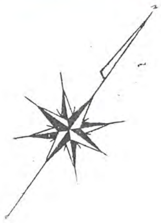
配置図 S = 300