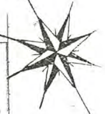
実測図 S = 1 : 200