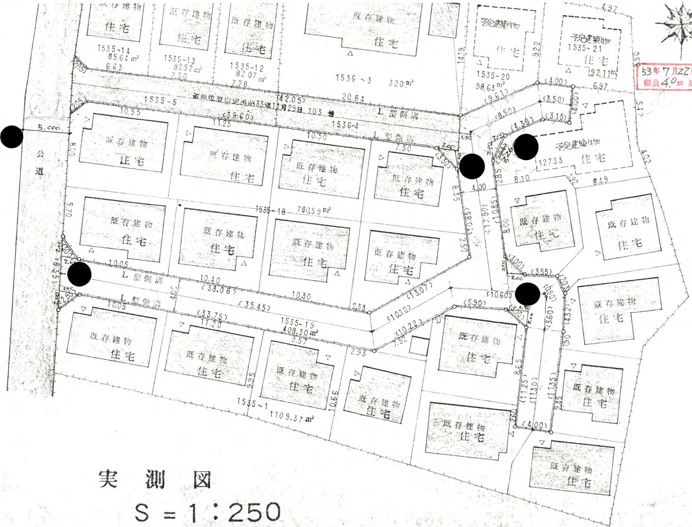
実測図 S = 1 : 250