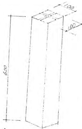
境界石 S = 1 : 10