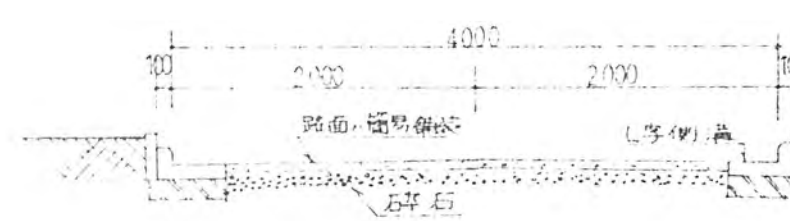
道路断面図 S =