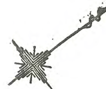
実測図 新座市野火止4丁目 1:250