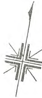
地積図 縮尺 1:300