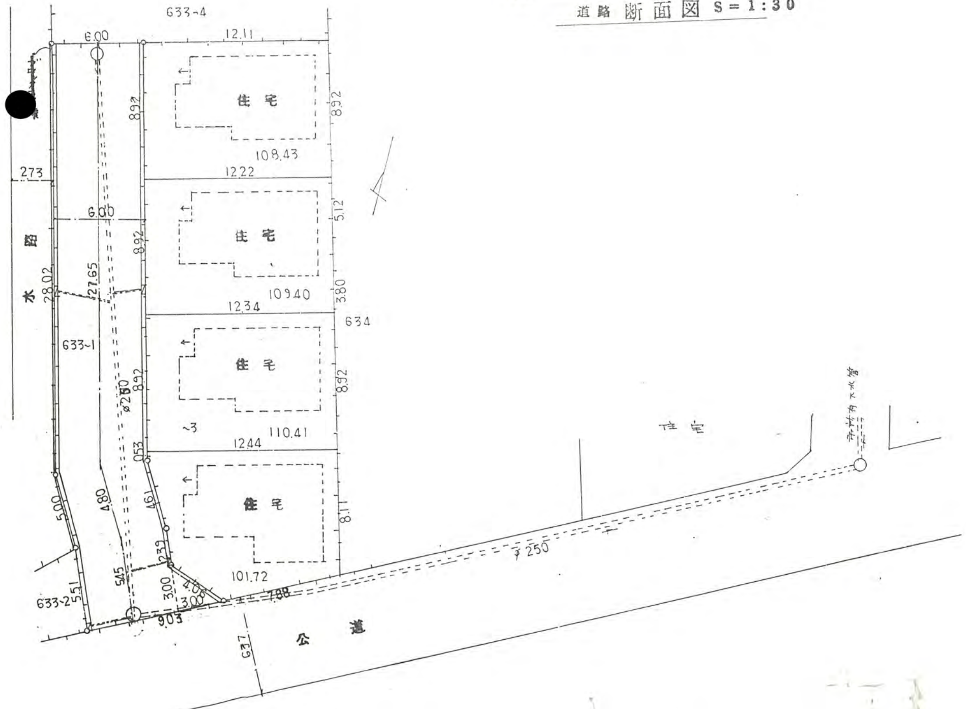
道路断面图 S = 1:30