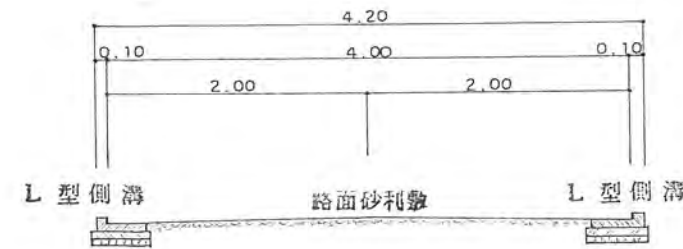
道路断面図 S = 1/50