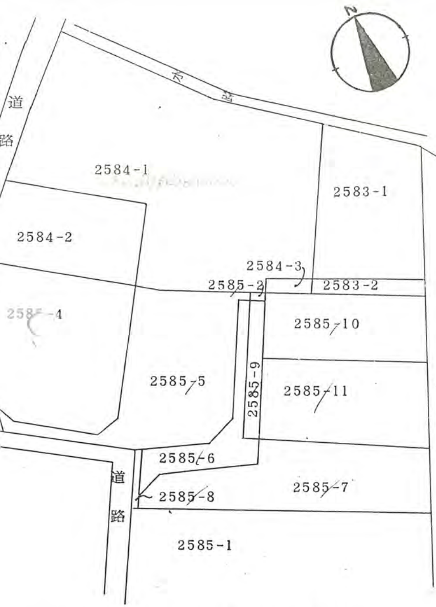
公 図 写 し 1 / 6 0 0