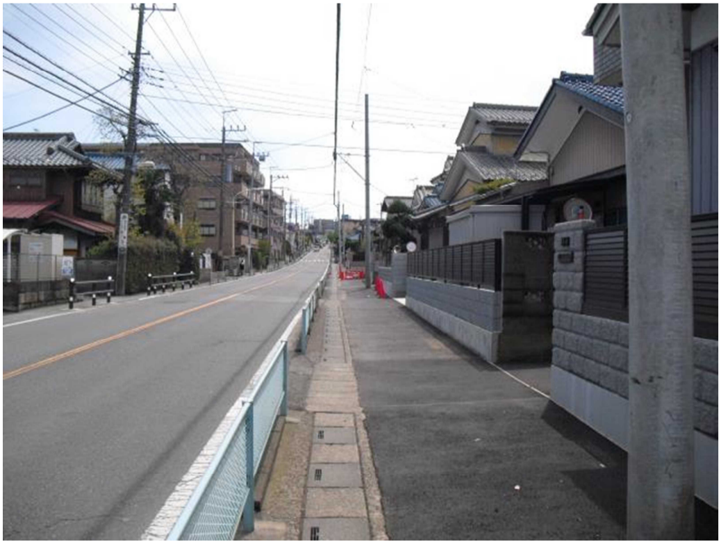
県道 新座和光線 歩道拡幅状況写真