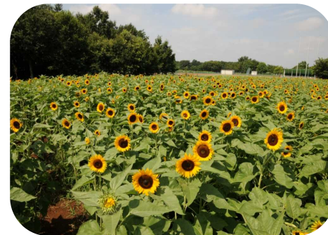
満開のヒマワリ畑