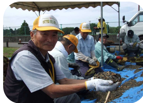
ヒマワリの種採り作業

「花達人(かだん)」に興味をお持ちの方は、観光推進課(048-477-1449)までお問い合わせください。