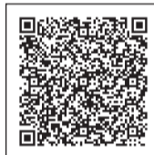
▲パソコン・スマートフォン用