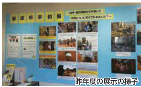
昨年度の展示の様子

市では、「健康平和都市」の宣言をしています。平和に関するパネルなどを展示する「新座市平和展」を開催します。 ▼日時／①7月21日(土)から27日(金)までの午前9時～午後9時30分(最終日は正午まで)、②28日(土)から8月3日(金)までの午前9時～午後9時30分(最終日は正午まで)、③8月6日(月)から15日(水)までの午前8時30分～午後5時15分 ▼場所／①中央公民館、②畑中公民館、③市役所第2庁舎1階市民ギャラリー ▼協力／広島平和記念資料館