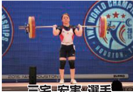
三宅 宏実 選手