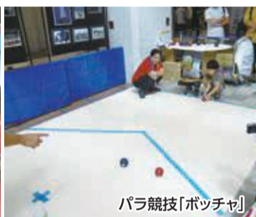
パラ競技「ボッチャ」