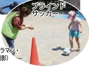
ブラインドサッカー