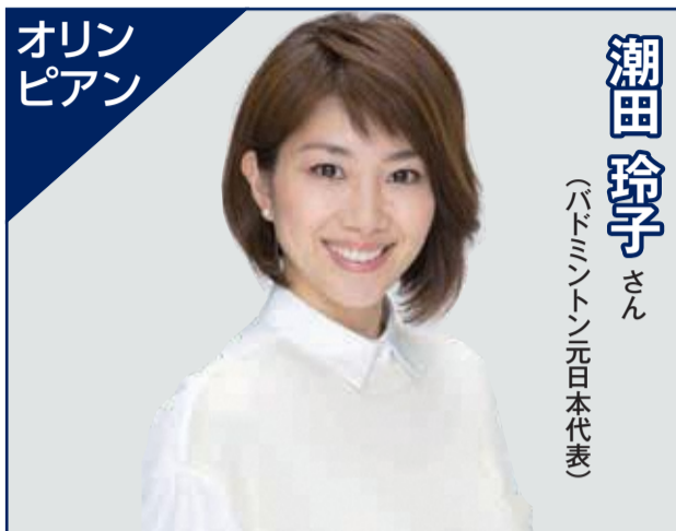
潮田 玲子さん (バドミントン元日本代表)