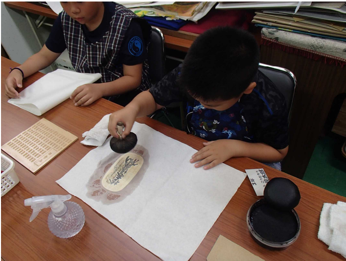
模造小判などを湿して画仙紙を乗せて慎重に墨拓を押しました、素敵な拓本ができました。