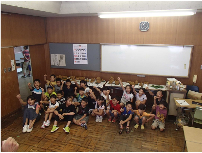
造ったぞー！と、みんなでガッツポーズ