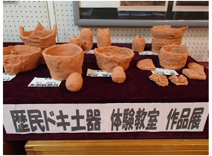
完成したオリジナル土器の作品展 (8/21~29)