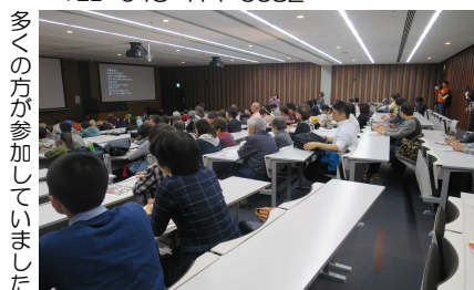
多くの方が参加していました