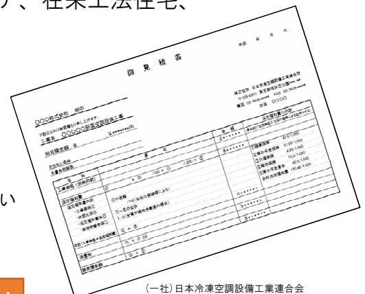
(一社) 日本冷凍空調設備工業連合会