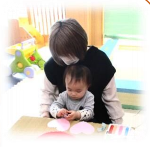
バレンタイン工作