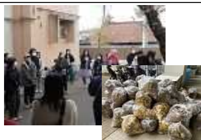
グリーン応援団による落ち葉掃き