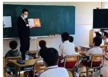
読み聞かせ応援団による読み聞かせ