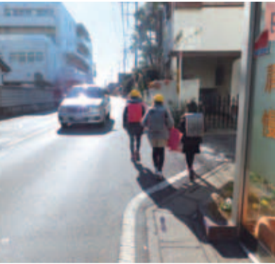
■安全対策が望まれる通学路

高齢者の見守りについて 問 東京都では、高齢者の見守りを一元化するために、シルバー交番設置事業を実施しているが、市でも一元化する考えはないか。 答 新たな拠点を整備するのではなく、これまでどおり高齢者相談センターを地域の拠点として見守りを進めていく。 自転車の高額賠償について 問 自転車所有者の賠償加入の義務付けについて、市の考えを伺う。 答 保険加入の義務付けは大変難しいが、保険の重要性は十分認識している。市ホームページで「自転車事故での加害事故例」や保険情報を引き続き掲載していく。また、交通安全事業を通じ、TSマーク付帯保険の周知活動を進め、加入促進も呼びかけていきたい。