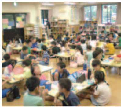
狭あい化の解消が望まれる東北小学校の放課後児童保育室

放課後児童保育室の指導員の処遇改善について 問 子ども・子育て支援新制度への移行に伴い、処遇改善等についてどのように考えているか。 答 現在、どういった処遇改善ができるか社会福祉協議会と協議している。今後、財政との調整ということになる。