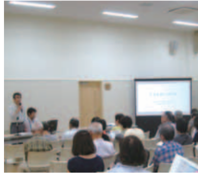
北野ふれあいの家で行われた住宅耐震化説明会の様子

地域支え合いボランティア事業の充実について 問 事業の普及への取組状況、昨年度の実績及び現状はどうか。 答 昨年度と比較すると登録者、利用者、利用時間等も増加している。今後も社会福祉協議会や商工会と連携して事業の周知に努める。