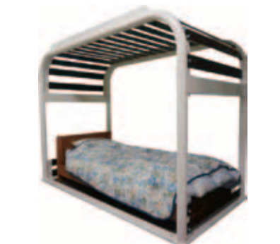
市の耐震改修等助成の対象となっている耐震ベッドの一例

広報の音声読み上げサービスについて 問 市ホームページで、広報にいたるの音声読み上げサービスを実施してはどうか。 答 平成27年1月号から、市ホームページに音声版の広報にいざを掲載する。