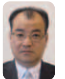
公明党 鈴木 秀一