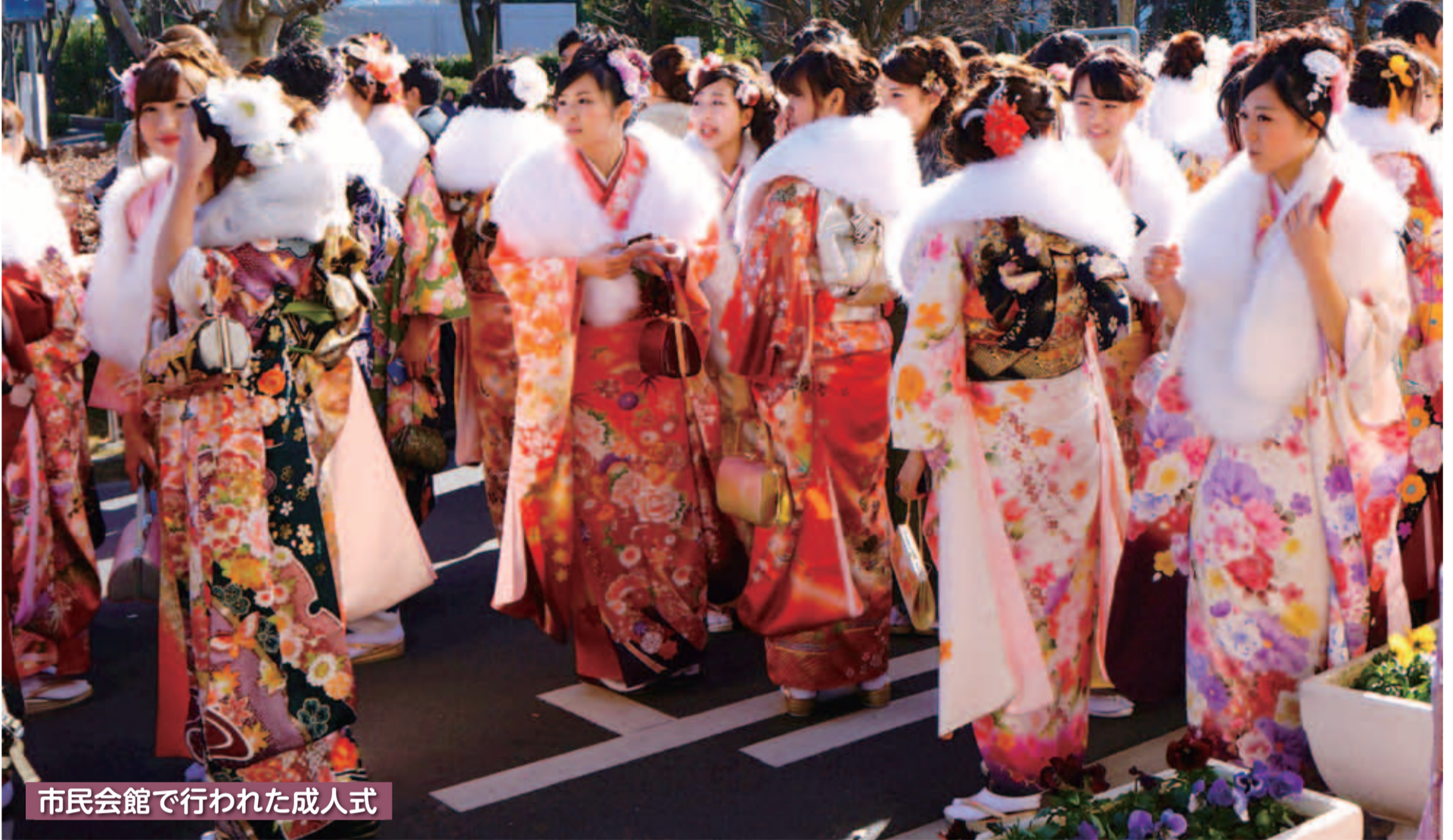
市民会館で行われた成人式