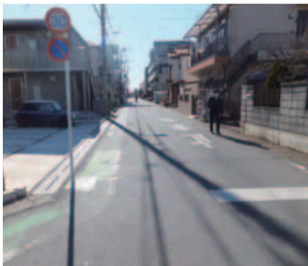
補修が予定されている市道