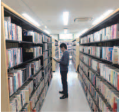
蔵書の充実を目指す中央図書館

答 図書館は、市民の生涯学習を支援する中核施設として利用者が増えており、今後は、蔵書の充実、講座事業の展開、情報検索機能の向上等市民の生涯学習を支援する施設作りを目指す。また、歴史民俗資料館は十分な展示スペースがない状況だが、ふるさと歴史館の建設も視野に入れながら、現状施設の充実・改善を図り、市民の郷土愛を深め、文化向上に寄与できる施設作りを目指していく。