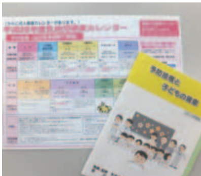
平成26年度乳幼児健康カレンダーと予防接種と子どもの健康の小冊子

公共ますの設置について 問 交通量が増加して道路上のマンホール周辺は痛みが激しく工事費がかかる。近隣3市のように新築の場合は、宅地内に公共ますを設置すべきではないか。 答 歩道のない県道や市道の交通量の多いところは、宅地内に設置させていただいている。