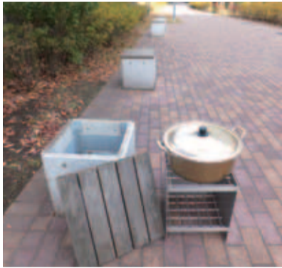
新塚緑道に設置されているかまどベンチ

出版社と協議をすると同時に、近隣市にも声を掛け、4市市長会での議題にも上げたい。