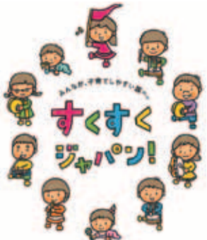
子ども・子育て支援新制度のシンボルマーク

市政全般にわたり、市長を始めとする執行機関に対して行う質問を一般質問といいます。その要旨をお知らせします。