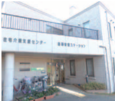
西堀・新堀地域を管轄する新座市西部高齢者相談センター(野火止四丁目)

問 国民健康保険事業特別会計は、平成26年度決算で剰余金が生じる見込みであり、国民健康保険税を引き下げるべきではないか。 答 現段階で医療費は予算と比べ約3億5千万円減ると見込まれるが、冬季のインフルエンザが流行すると医療費が増えるので、医療費の動向を見て最終的に判断する。