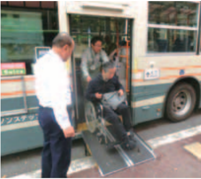
スロープ板付きノンステップバスから降車する車椅子利用者の様子