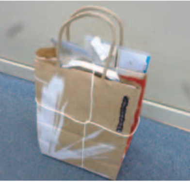
■雑がみの出し方の一例

新座市障がい福祉計画について 問 ①次期計画の中で障がい者福祉施策をどのように充実させていくのか、市の考えを伺う。②県内でも、市街化調整区域に障がい者グループホームの建設を許可する自治体がある。本市でも、検討すべきと考えるがどうか。 答 ①施設整備を始めとした課題が山積しているが、サービス量の充実も含めて、今後も障がい者福祉施策の充実に努めていく。②引き続き、埼玉県の審査基準に基づき許可をしていく考えであり、市街化調整区域での障がい者グループホームの建設を許可する考えは現時点では持っていない。