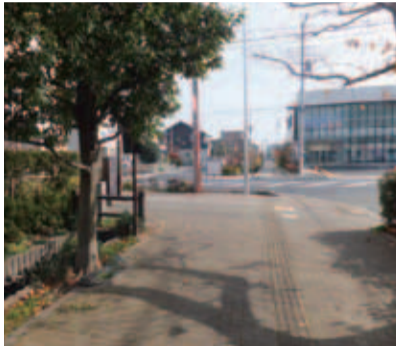
野火止用水支流からのせせらぎ復活が望まれる新座駅南口公園周辺

社会福祉協議会の移転について 問 本庁舎の建替え方針が決定した。耐震強度が不足する第三庁舎の社会福祉協議会を、本庁舎の近くに移転する考えはないか。 答 現在、新庁舎の基本設計を進めており、社会福祉協議会の本庁舎の近くにあつたほうがいいという意見は大変多いが、床面積に余裕がなく、現段階で新庁舎及び第二庁舎への機能を移転することは難しい。今後、最終的に移転が難しい場合には、第三庁舎の在り方の早急な検討に入る。