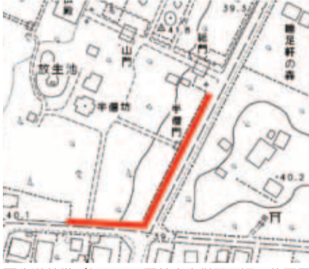
歩道整備が行われる平林寺半僧門周辺の位置図