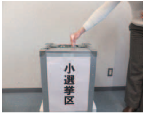
投票所のイメージ風景

◆軽度外傷性脳損傷の周知及び労災認定基準の改正などを求める意見書(平成26年12月26日) 提出先 衆議院議長 参議院議長 内閣総理大臣 総務大臣 文部科学大臣 厚生労働大臣