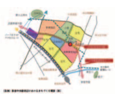
(仮称)新座中央駅周辺におけるまちづくり構想(案)

答 平成26年11月19日に東日本高速道路(株)等の関係機関と第1回新座スマートICの設置に向けた調整会議を開催した。今後も開設の可能性について協議していく。