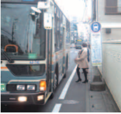
安全対策が望まれるバス停付近

答 県では通学路の安全対策事業として、たまり場空間の整備を始めた。スポット的な歩道整備として、同バス停もこの事業に組み込めないか検討するとの回答だった。事業採択されるよう強くお願いしていく。