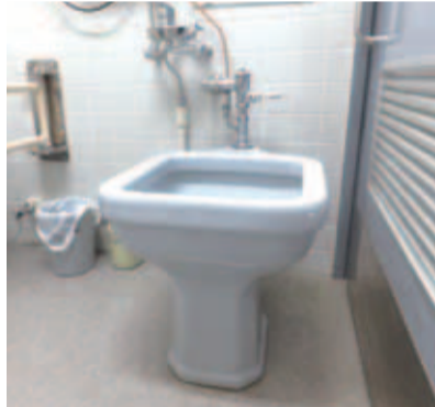
市庁舎内にあるオストメイト