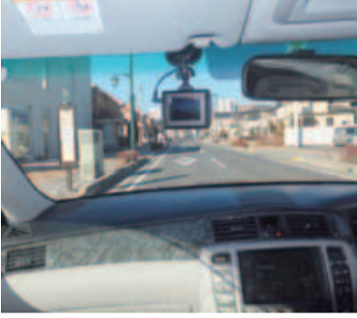
議長車に設置されているドライブレコーダー

答 平成27年度へ向け早速検討し、公用車は120台のうち、利用頻度の高い車両に設置していきたい。