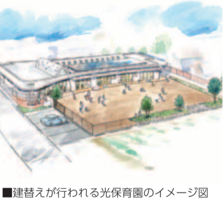
建替えが行われる光保育園のイメージ図