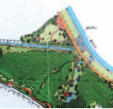
■栄一丁目緑地基本計画図 (抜粋)

雑がみの分別について 問 可燃ごみとして排出されている雑がみの分別、再資源化を進めるために雑がみ回収袋を各家庭に配布してはどうか。 答 メモ用紙、紙袋などの雑がみは、リサイクル可能な雑誌に分類されているが、可燃ごみとして出されることが多く、雑がみ回収袋の配布は有効な手段である。市ホームページに雑がみの出し方を掲載し、2月の広報でごみ特集を行い、雑がみの分別を推進していく。