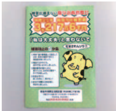
振り込め詐欺防止のパフレット

問 高齢者を狙った詐欺的トラブルは一向に減少しない。防災ラジオのように千円程度の負担で購入できる助成制度ができないか。