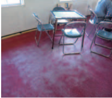
改修の要望がある第二老人福祉センター内の様子

市民向け逸品カタログの作成について 問 現在、'すくすく新座'発見ウォーキング参加者に、にいざ逸品カタログが配布されているが、地域活性化対策の充実のため、新座市民版を作成し、地元商店のPRをしてはどうか。 答 年間を通じて市民の皆さんに活用していただけるような方策について、商工会と連携を図り、早速検討したい。