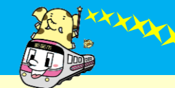
大江戸線と周辺鉄道路線図