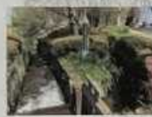
野火止用水分岐点