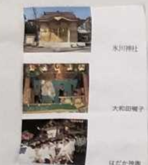
氷川神社 大和田庵子 はだか神輿