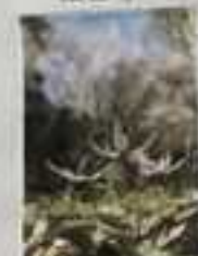
3月下旬4月上旬頃野寺カタクリの山