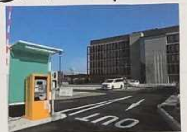
⑯ ⑰ ⑱ ⑲ ⑳