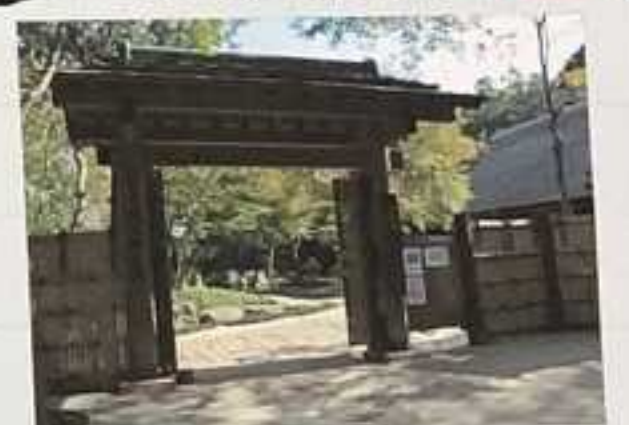
⑮ 市役所 13:50