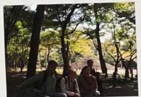
⑭ 睡足軒 13:40