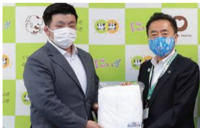
▶株式会社新興商事から市へ、防護服250枚(14万円相当)