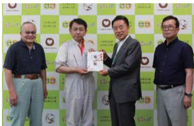
▶新座市商工会から市へ、マスク3,000枚(18万円相当)