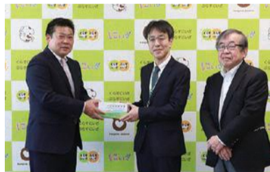
▶株式会社ココ・エステートから市へ、マスク2,000枚(12万円相当)