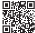
▲ブラジル政府観光局の動画はこちら

世界3都市(サンパウロ、ロサンゼルス、ロンドン)にあるジャパン・ハウスが初めて開館した都市はサンパウロです。