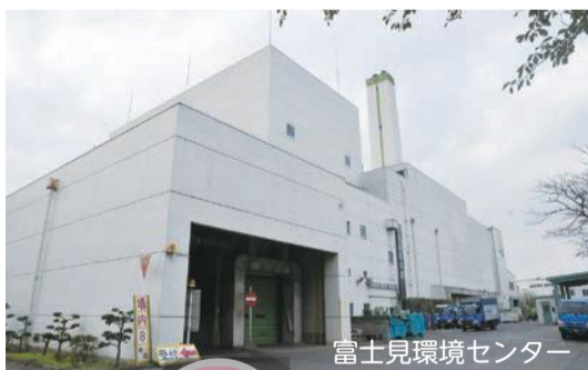
富士見環境センター

新座市で回収したペットボトル・プラスチックごみは、志木地区衛生組合(新座・志木・富士見市で構成)に集めて資源プラスチックを選別し、再資源化しています。