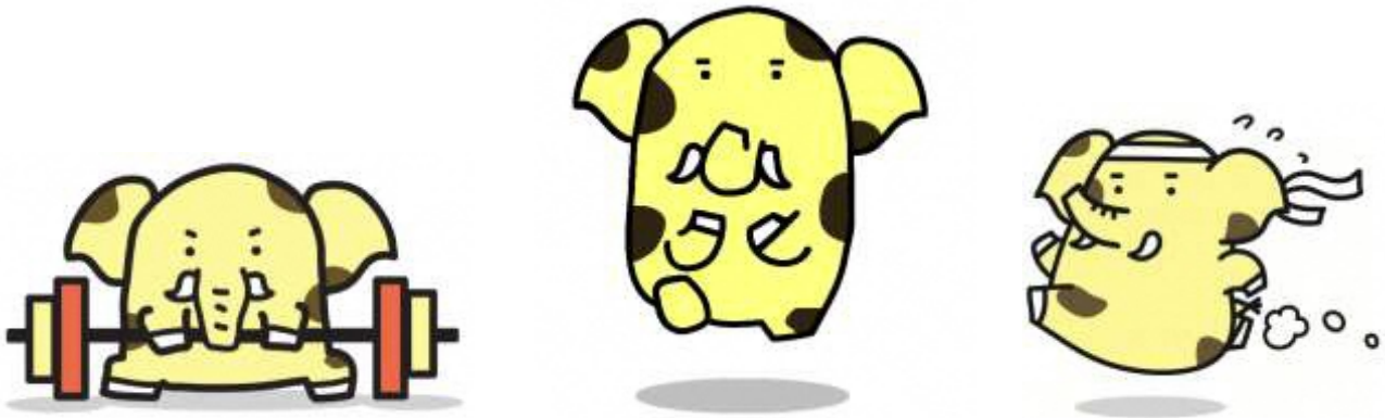
新座市イメージキャラクター ゾウキン