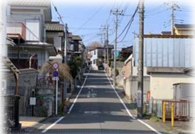
急勾配な坂 登りはつらい…