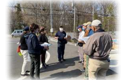
真剣に話を聞いています