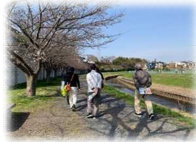
整備された遊歩道は 地域のみなさんの散歩道に