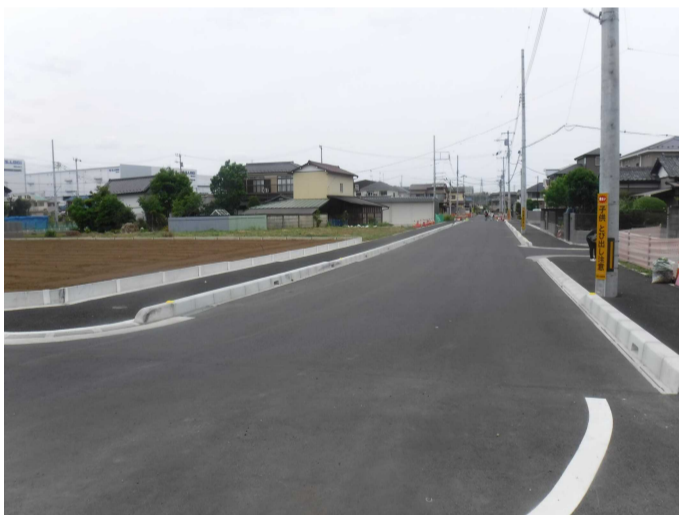
区 10.5-1 号線 道路築造完成写真