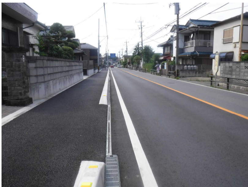
県道新座和光線 歩道築造完成写真

なお、清算金の算定期間については、事業の終了時点(施行地区内の工事が全て終了した段階)に行う予定です。