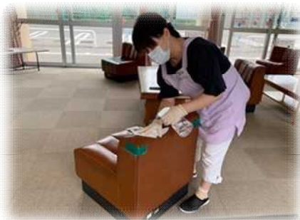
念入りに消毒作業

定期的な消毒作業も実施されており、感染防止に力を入れていることがよくわかります。今後の運営についても、より安心して利用ができるように計画されているということです。