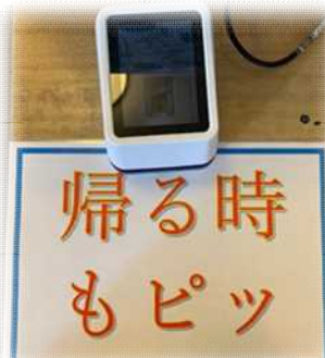
利用者証をカードリーダーでピッ！