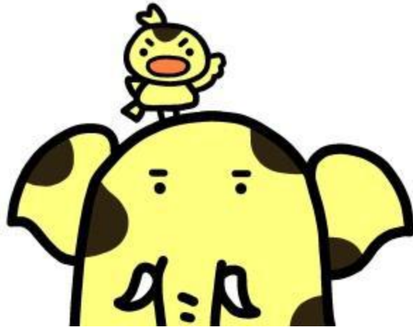
新座市イメージキャラクター ゾウキリン