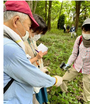
草花の特長や生育の様子を共有♪