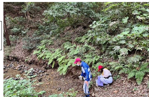
沢の近くまでゴミが落ちているなんて…