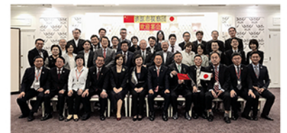
令和元年10月 济源市来訪歓迎レセプション