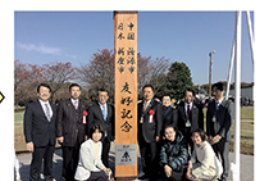
平成28年11月 新座牡丹園除幕式