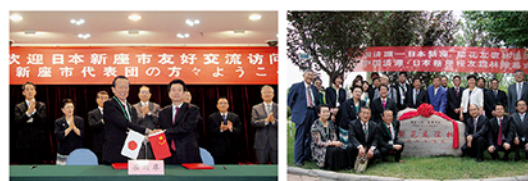
平成28年5月 市民訪問団济源市訪問 桜友好の森除幕式