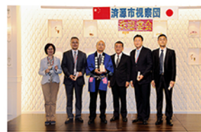
平成27年10月 济源市視察団来訪