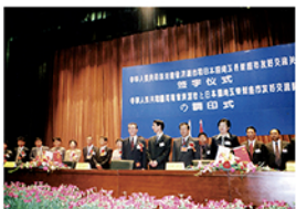
平成14年5月 友好都市提携調印式