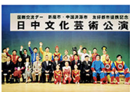
平成15年2月 济源市との文化交流展