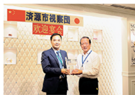
平成25年9月 济源市視察団来訪