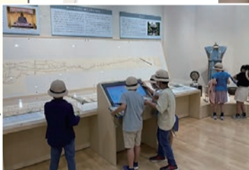
▲子どもたちも興味津々

旧石器時代から現代まで、市内の歴史を振り返る貴重な資料を展示しています(常設展も定期的に資料を入れ替えています)