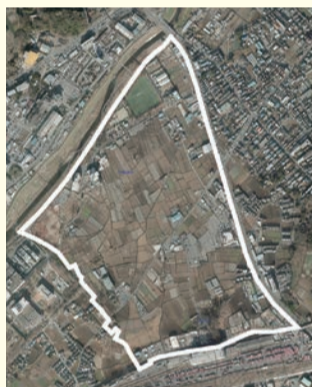
事業前(平成24年12月撮影)