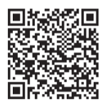
▲電子申請はこちら

▼申込み及び問合せ/対象施設を予約後、宿泊予定日の前月1日以降に電子申請又は被保険者証を持参の上、国保年金課(☎048・424・4853)若しくは長寿はつらつ課(☎048・424・9610)へ※別世帯の申請は委任状が必要です