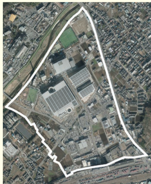
事業後(令和5年1月撮影)

新座都市計画事業大和田二・三丁目地区土地区画整理事業は、事業認可から約7年を経て、令和5年3月24日に換地処分の公告を行い、登記の変更が完了しました。今後は、清算金の徴収と交付を行う予定です。ご協力いただいた地権者の皆さま、関係者の方々に深く感謝いたします。