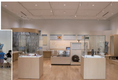
▲展示室は明るく開放的