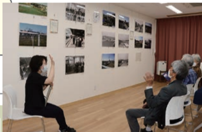
▲研修室で開催したパネル展に合わせたギャラリートーク