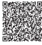
▲電子申請はこちら

▼申込み及び問合せ／8月1日(火)午前10時から、電子申請、窓口又は電話で介護保険課 ☎048・424・5186へ