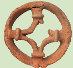
▲土製耳飾り(大和田カミ遺跡出土)

耳飾りは今のイヤリングやピアスにあたるもので、直径約10cmと大ぶりのアクセサリーを身に付けていたことが分かります。