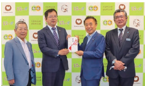
▲新座中央ライオンズクラブから市へ、花き苗など(10万円相当)