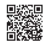
▲県女性キャリアセンターホームページはこちら

▼申込み及び問合せ／県女性キャリアセンターのホームページから、同センター ☎048・601・5810、月曜から土曜日までの午前9時30分～午後5時30分へ