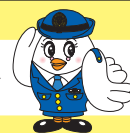
埼玉県警察マスコット 「ポポ美ちゃん」