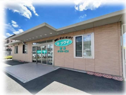
高齢者デイサービス施設 ツクイ新座