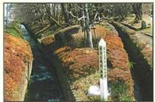
野火止用水分岐点