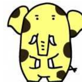
新座市イメージキャラクター ソウキリン