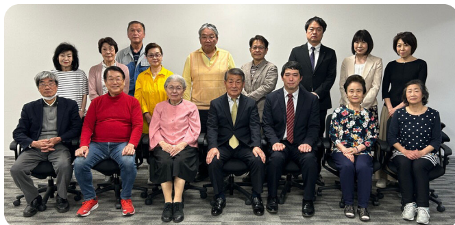
令和7・8年度 理事のみなさん