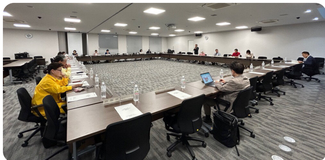
4月21日に開催した評議員会の様子