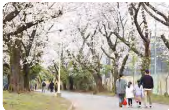
📍栄緑道 📷新塚一丁目地内 (市民カメラマン・岩井 章弘さん撮影)