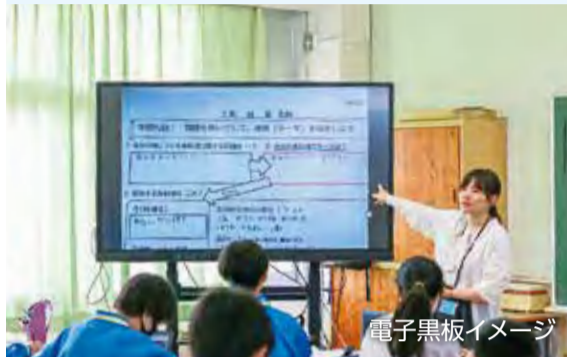
電子黒板イメージ

デジタル技術の活用による市民の利便性向上・業務の効率化、児童貸与のタブレット端末の更新、電子黒板活用 など