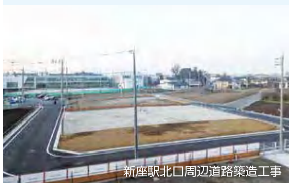
新座駅北口周辺道路築造工事