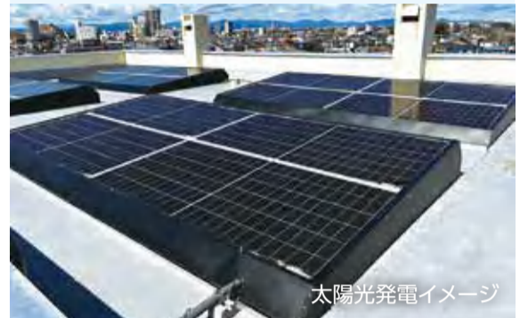
太陽光発電イメージ

市民向けの補助、小・中学校への太陽光発電設備設置、公共施設のLED照明化、電気自動車の購入 など