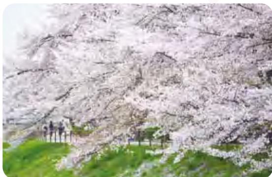
📍黒目川沿い 📷池田二丁目地内