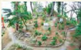
▲片山富士

塚の原形をよく留め、富士講徒によって築かれた塚であることなど、富士塚の構成要素を示すものが残されていることから、令和2年に市の有形民俗文化財に指定しました。