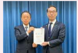
▲埼玉県に要望書を提出

新座市、清瀬市、所沢市及び練馬区で構成する都市高速鉄道12号線延伸促進協議会では、大江戸線光が丘駅からJR武蔵野線東所沢駅までの早期延伸実現の要望書を、埼玉県及び東京都にそれぞれ提出しました。