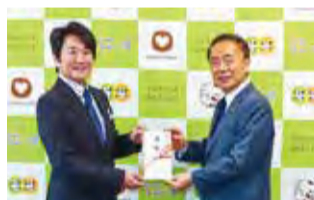
▲幸町歯科口腔外科医院から コブシ福祉基金へ、10万円

市(一般寄附)へ (株)グリーンハーモニー から学校の花壇などで 使用する堆肥 (8万4,515円相当)