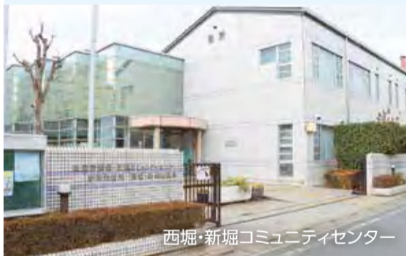
西堀・新堀コミュニティセンター

空調設備の更新、トイレの洋式化、消火栓修繕、西堀・新堀コミセンの長寿命化改修工事基本設計 など