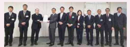
▲東京都に要望書を提出