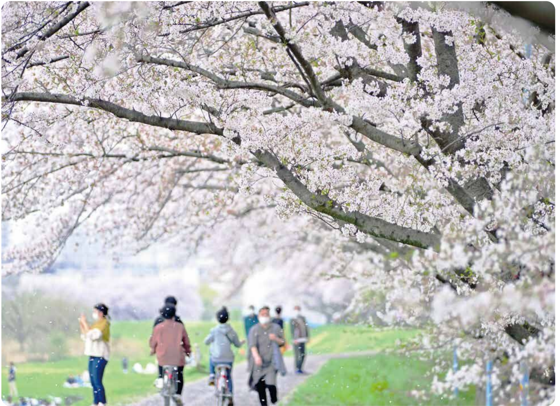
📍柳瀬川沿い 📷大和田四丁目地内