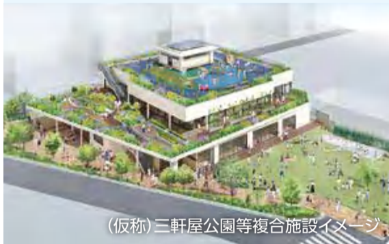
(仮称)三軒屋公園等複合施設イメージ

三軒屋公園・東北コミュニティセンターの敷地を活用した新たな複合施設建設の設計 など