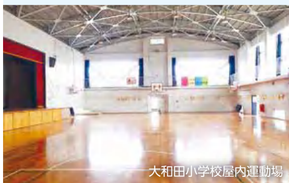
大和田小学校屋内運動場