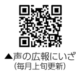
▲声の広報にいざ (毎月上旬更新)