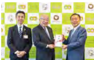
▲さいしん新座会から コブシ福祉基金へ、5万円