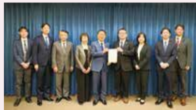
▲埼玉県に要望書を提出

町内会長や市内関係団体の代表者などで構成する新座市都市高速鉄道12号線延伸促進期成同盟会では、県への要望活動などを行いました。