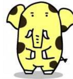
新座市イメージキャラクター ソウキリン