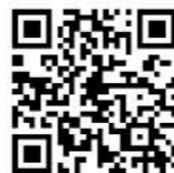
子ども・赤ちゃんとの防災 (教えて!ドクターHP) https://oshiete-dr.net/column/bousai/

赤ちゃんは普段と違う環境で不安な気持ちになってしまいます。お気に入りのおもちゃや好きなものを与えてあげましょう。また、ストレスから夜泣きやわがままな行動をとってしまうことがあるかもしれません。極力、怒らないようにしましょう。 避難生活が長引くと、赤ちゃんだけでなく、パパ・ママも疲れてきます。抱え込まずに信頼できる人や避難所のスタッフなど周りとのコミュニケーションをとりましょう。 日頃から地域の方と顔の見える関係を作っておくと、いざという時に安心です。