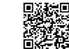
避難所のルールはこちら