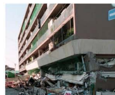
阪神淡路大震災で被災した集合住宅

「長周期地震動」は、比較的大きな地震の際に発生する、揺れの周期が長い地震動であり、長時間、ゆっくりと大きな揺れが継続するという特徴があります。高層ビルは低い建物に比べ、長周期地震動で揺れやすく、高層階になるほど被害は大きくなり、エレベーターの障害が発生することもあります。また、長周期地震動は、震源から遠くても減衰しにくい特徴もあります。