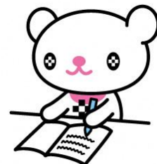
十文字学園女子大学 マスコットキャラクター プラスちゃん

経済に関するお話やテーブルゲームを楽しみながら、身近だけど意外と知らない「お金」について、もっと詳しくなろう！