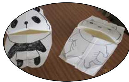
牛乳パックで作ったパックン君