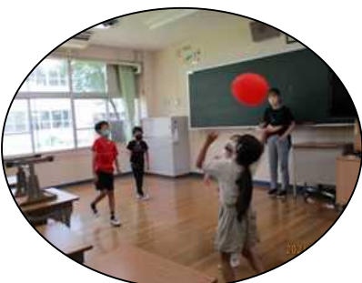
風船バレーボール遊び