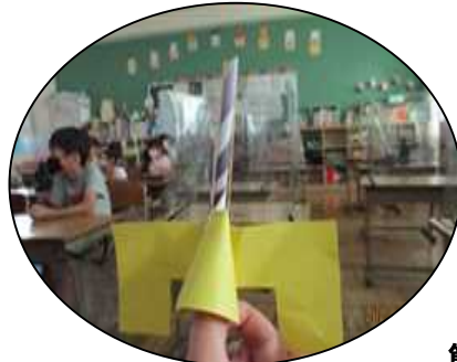
画用紙で作ったロケット的あて