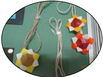
折り紙でつくったひまわりペンダント