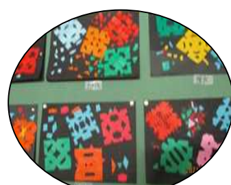
折り紙で作った花火