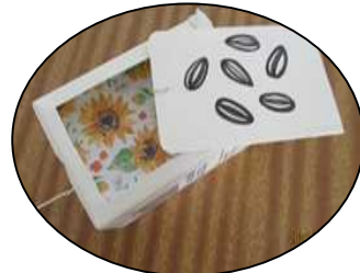
牛乳パックで作った変身ボックス