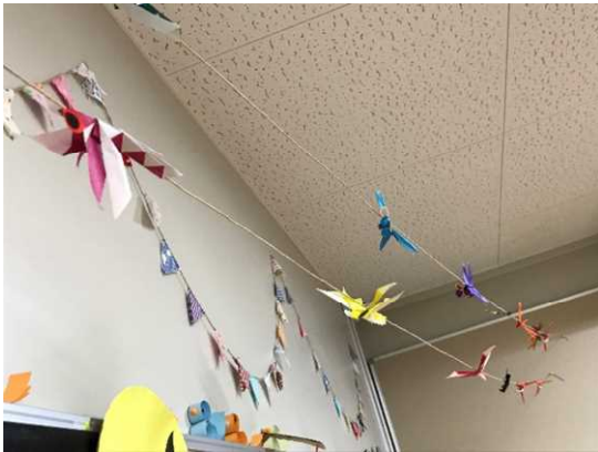
「トンボが飛び始めました」