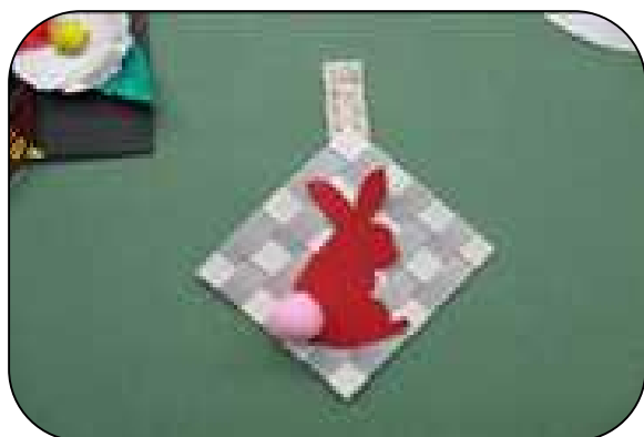
冬休み工作 ウサギの壁掛け

その他：申込用紙及び申込案内につきましては、後日、本校全児童の皆さん（現1年生～5年生）にお配りいたしますので、よろしく願いいたします。