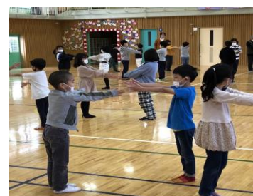
不審者から逃げられない時は 身をかかめて石に！！ なかなか持ち上がりません。