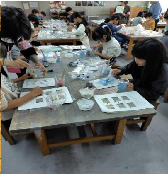
十文字学園女子大学の皆さんによるイベント