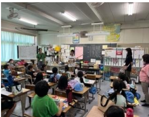
地域ボランティアの方によるイベント

* 4年生以上の兄弟に限り、下校時にココフレンドに立ち寄り、一緒に下校することができますが、一旦下校した兄弟のお迎えはできません。