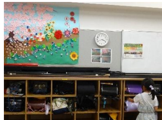
ロッカー(ランドセルなどの荷物を入れます。)