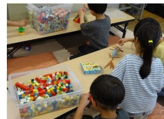
自由時間にレゴやボードゲームなどで遊ぶ場所です。