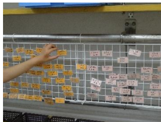
名札掛け(自分の名札を取ります。)