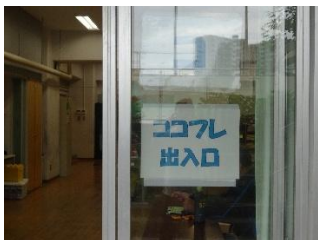
ココフレンドルーム出入口

4月からココフレンドルームが新しい場所に移り1ヶ月余りが過ぎ、こどもたちも大分慣れてきました。ココフレンドルームの様子が少しでもわかるように写真を掲載します。